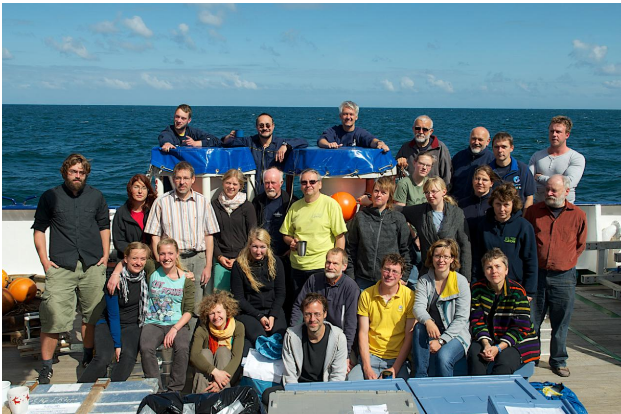
Gruppenfoto: Die Mitglieder des wissenschaftlichen Teams der M87/4

Wenn auch die Natur sich von einer etwas anderen Seite zeigte als erwartet, so blicken wir doch auf eine sehr erfolgreiche Ausfahrt zurück, die insbesondere unser Verständnis der Bedeutung physikalischer Prozesse für die Entwicklung der Cyanobakterien in der Ostsee viele Erkenntnisse gebracht hat. Und, immer im Auge behaltend, dass ein Fahrtleiter nicht alles an Bord mitbekommt - was auch gut so ist – hat es den Anschein, als ob die Fahrtteilnehmer fast ausnahmslos zufrieden und froh sind, bei dieser Expedition dabei gewesen zu sein; auch wenn dies ebenso für den Umstand gilt, in nunmehr etwa 12 Stunden wieder den Fuß an Land setzen zu können.