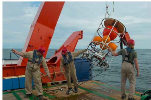
Zu guter Letzt doch wohlbehalten und voller Daten an Deck: die GODESS-Verankerung

An das Meer verloren haben wir also nichts auf unserer Fahrt (ein Handnetz, um ganz korrekt zu sein), wohl aber viel gewonnen, denn es zeigte sich, dass sowohl die aufzeichnenden Komponenten des Drifters wie auch die Speicher-CTD-Einheit der GODESS-Verankerung erfolgreich über den gesamten Einsatzzeitraum Daten aufgezeichnet haben, und auch die Sinkstofffalle hatte bis zum Ende ihres Programms Proben genommen. Die letzte Stationsarbeit diente schließlich dem Abgleich der zwei Stunden nach der Bergung bereits ausgelesenen Speicher-CTD der GODESS-Verankerung und der mit doppelter Sensorik ausgestatteten CTD am Kranwasserschöpfer. Ein gewisser Zynismus der Natur war hierbei, dass zu diesem